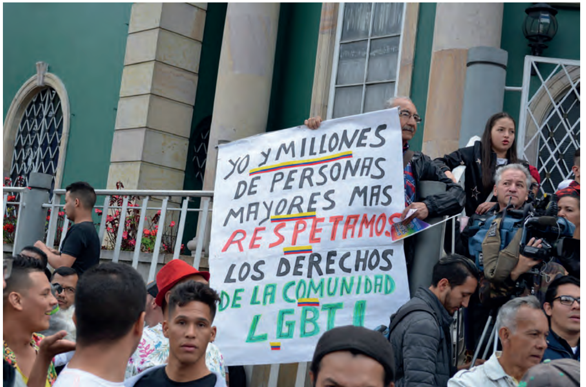
Marcha del orgullo en Bogotá. 2019.