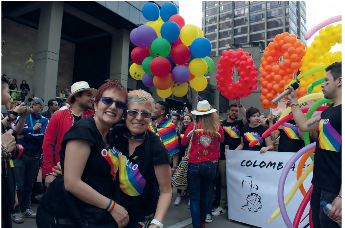
Marcha del orgullo en Bogotá. 2019.