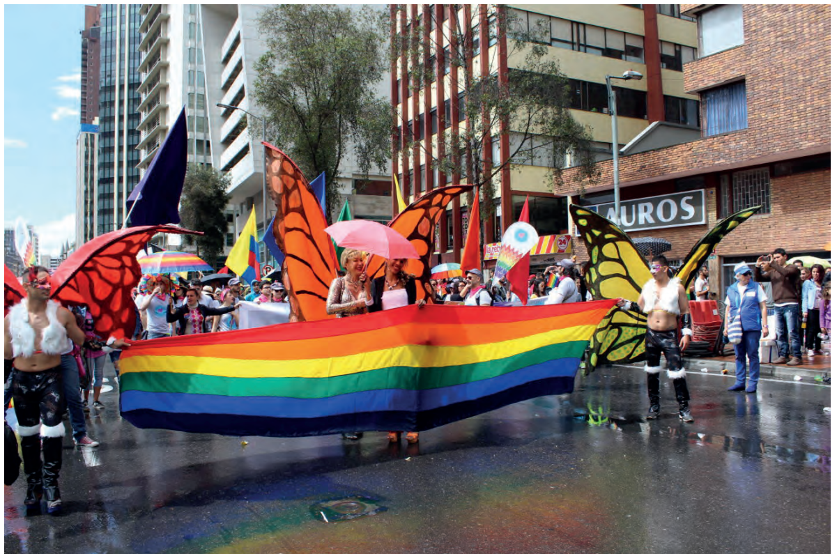
Marcha del orgullo en Bogotá. 2016.